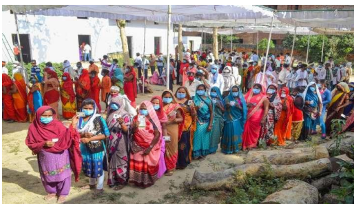
पंचायत चुनाव में महिला