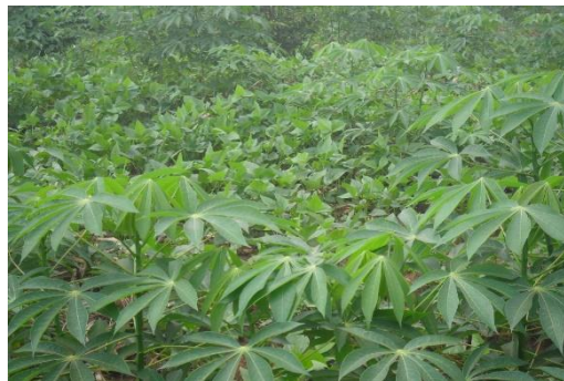
Photo 7 : Association manioc niébé à Ablomè Prise de vue: Belakon, Septembre 2015

C'est un mélange de cultures sur un même billon ou planche. La photo 7 présente une association de culture à Ablomè.