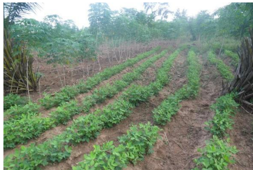
Photo 4 : Labour en billons à Tadokome Prise de vue : Koumassi H., 2016

Le labour en billons est une technique qui consiste à découper une portion de terre et à la retourner sur son pivot à l'aide de la houe. Ce type de labour est le plus utilisé par des agriculteurs dans la Commune de Athiémié selon 97 % des enquêtés (Photo 4).