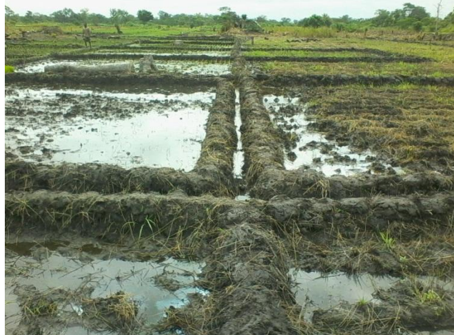
Photo 6: Labour en casier à Kpinnou Prise de vue: Belakon, septembre 2015

L'installation des casiers est une technique agricole qui se fait uniquement par les riziculteurs, car elle se pratique dans les bas-fonds. La photo 6 présente des producteurs de riz installant des casiers dans un bas-fond à Gouti.