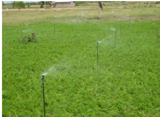
Photo 3 : Système d'irrigation automatique Prise de vue : Koumassi H., 2016

La photo 2 montre un système d'irrigation PVC. Ainsi dès que la motopompe est actionnée, elle refoule l'eau dans les bassins qui à son tour les renvoie dans les périmètres via les tuyaux perforés. Ce système est selon 93 % utilisés sur les cultures pérennes comme de riz. Un autre système consiste aussi à installer un réseau de tuyau muni de vannes sur le périmètre (Photo 3).