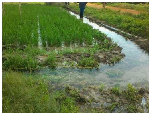
Photo 2 : Système d'irrigation PVC

L'observation de la photo 1 montre qui est entrain d'arroser à l'aide des tuyaux un champ de légume à Bédji. Selon 89 % des enquêtés, ce système est souvent adopté par les populations qui cultivent les produits maraichers. L'avantage de l'utilisation de ce système réside dans le souci de contrôler la quantité d'eau fournie aux cultures selon 87 % des populations enquêtées. Un autre avantage de ce système est qu'il permet d'homogénéiser la quantité d'eau fournie aux cultures. Ainsi, les chances d'avoir les mêmes niveaux de pouce pour toutes les cultures. Le système consiste à cerner le périmètre à l'aide des tuyaux PVC préalablement perforés (photo 2).