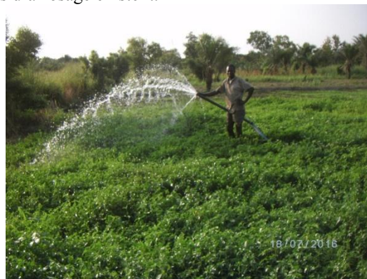
Photo 1: Irrigation manuelle d'un champ de légume à Bédji Prise de vue : Koumassi H., 2016

Dans ces systèmes deux possibilités d'arrosage existent.