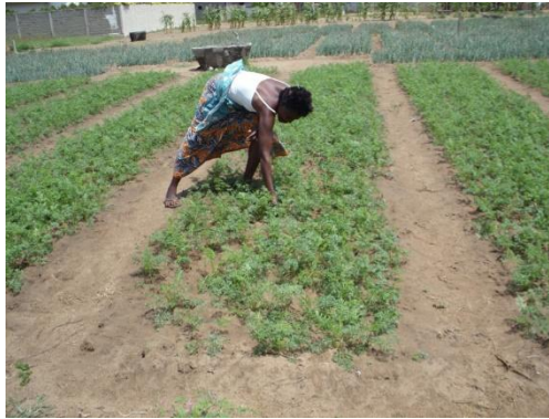
Photo 5: Labour en planches à Athiémé Prise de vue : Koumassi H., 2016

Le labour en planches est une technique agricole qui se fait sur un même espace grâce aux planches. La photo 5 montre un type de labour en planches à Athiémé.