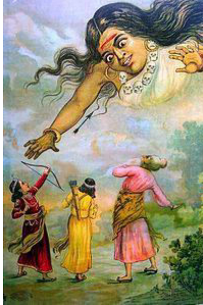
रामलक्ष्मणौ विश्वामित्रस्य शुश्रूषायाम्ताडकावधम्

विश्वामित्रः दशरथात् लक्षणसहितं रामम् अयाचत्, [४४] यतो हि यज्ञस्य विघ्नोच्चाटनाय तस्य आवश्यकता आसीत्। कष्टेन अपि दशरथः लक्ष्मणसहितं रामं विश्वामित्रेण सह प्रैषयत्। पितुः आज्ञां, मातृणाम् आशीर्वादान् च प्राप्य तौ कुमारौ ऋषेः अनुगमनम् अकुरुताम्। मार्गे विश्वामित्रेण ताडकाकथा श्राविता आसीत्। तया ताडकया निर्जिनकृते मार्गे विश्वामित्रसहितौ तौ कुमारौ अचलताम्। [४५] तस्मिन् मार्गे एव ताडका तेषां सम्मुखे उपस्थिता। तीव्रवेगेण वृक्षान् कम्पयन्ती मृतकचीवरवसा शब्देन उग्रया तया ताडकया श्मशानोत्थया वात्येव भरताग्रजस्य उपरि आक्रमणं कृतम्। यष्टिवत् एकां भुजां उपरि उन्नितवतीं, मनुष्याणाम् आन्त्रमेखलां कटिप्रदेशे धृतवतीं च ताडकां दृष्ट्वा नारीवधनिमित्तां जुगुप्सां शरेण सह रामः त्यक्तवान्। (यद्यपि नारी अवध्या। परन्तु आततायिनी न।) रामशरेण तस्याः हृदयं भेदितम्। एवं शरभिन्नहृदया सा भूमौ निपतिता।